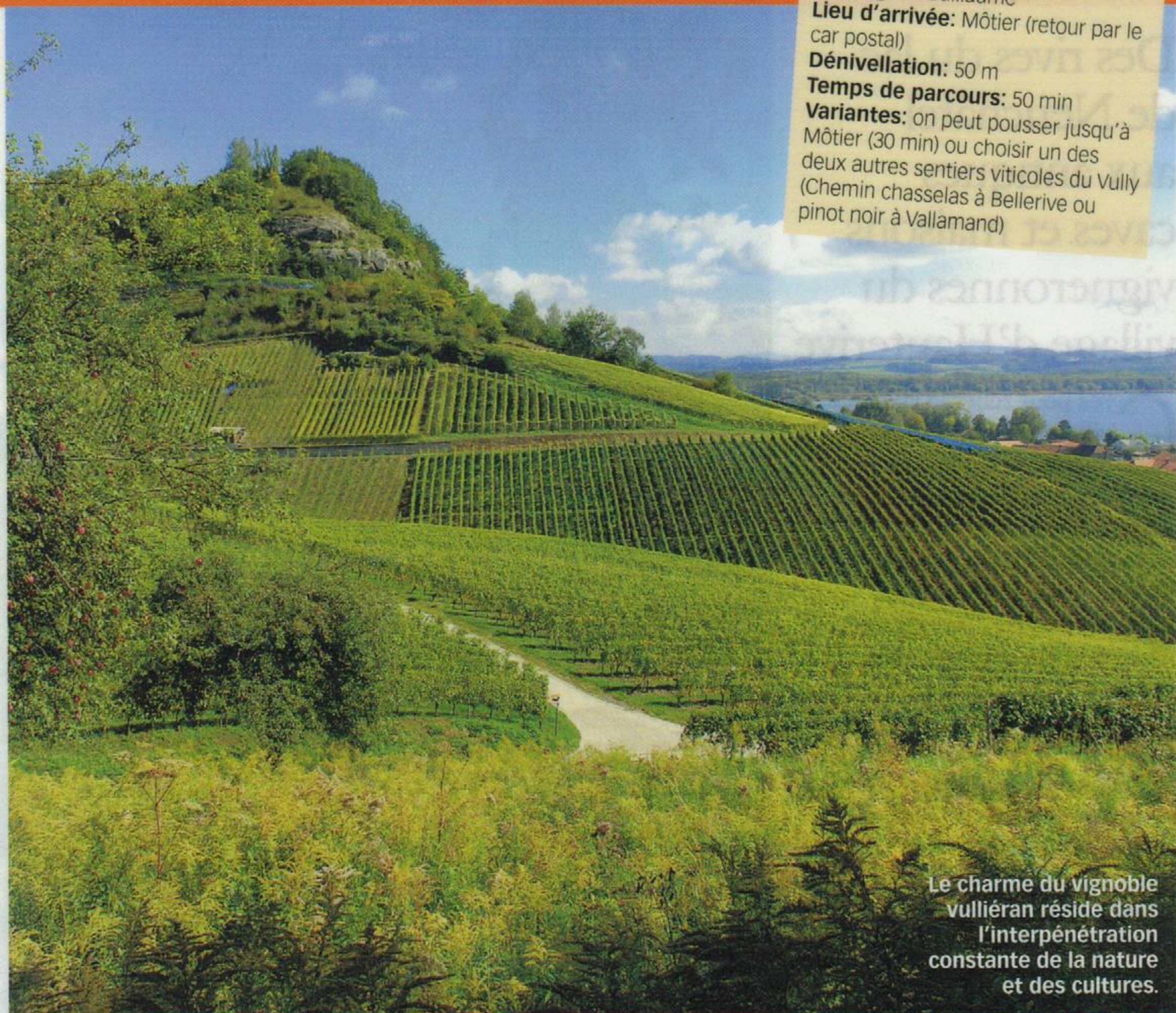
Le charme du vignoble vulliéran réside dans l'interpénétration constante de la nature et des cultures.