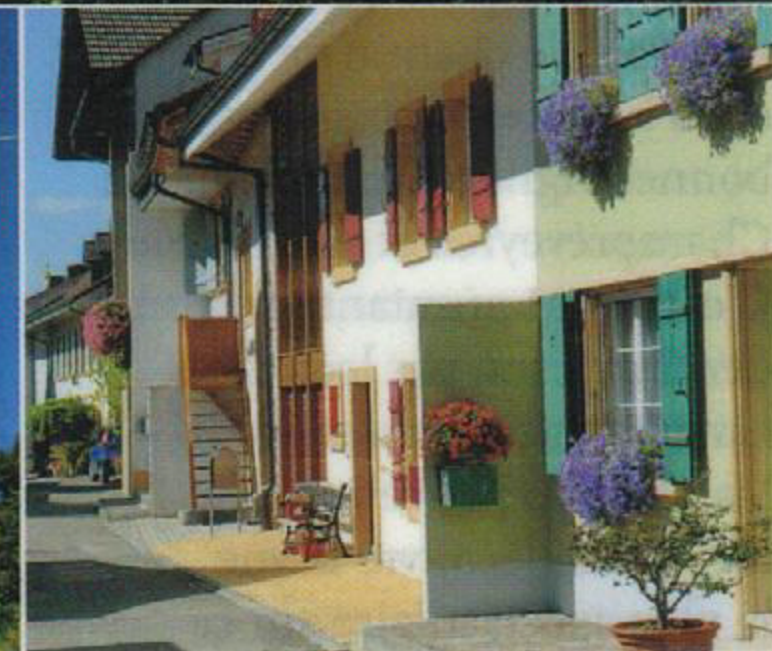
Môtier est le plus charmant des villages des rives du lac de Morat.